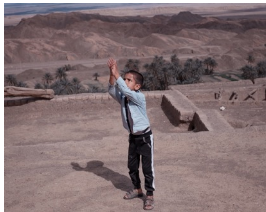
6. Alfio Tommasini, Serie Pairidaēza , 2019