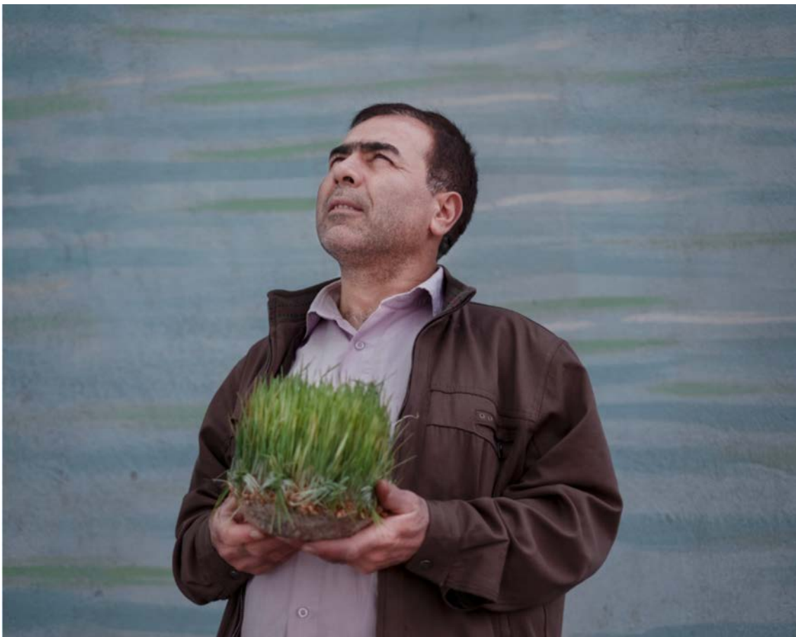
Alfio Tommasini, Série Pairidaēza , 2019 © Alfio Tommasini

Schliesslich befasst sich die Serie mit der Kunst und der Nutzung von Gärten in den iranischen Grossstädten der heutigen Zeit. Die alten persischen Gärten prägen immer noch das Leben der Iraner*innen. In Teheran, Isfahan oder Schiras werden weitläufige grüne und blühende Paradiese täglich von Familien oder Freundesgruppen aus allen Gesellschaftsschichten besucht. Die alten, kunstvoll verzierten Pavillons haben neuen, überraschenden Ornamenten Platz gemacht, und man trifft sich hier, um die Schönheit der Vegetation zu geniessen und einzigartige Momente zu verbringen. Durch seine Mauern vom Alltag abgeschirmt, wird der Garten als Paradies im menschlichen Massstab erlebt, als Raum der «Freiheit», in dem Poesie Gestalt annehmen und sich ausdrücken kann.