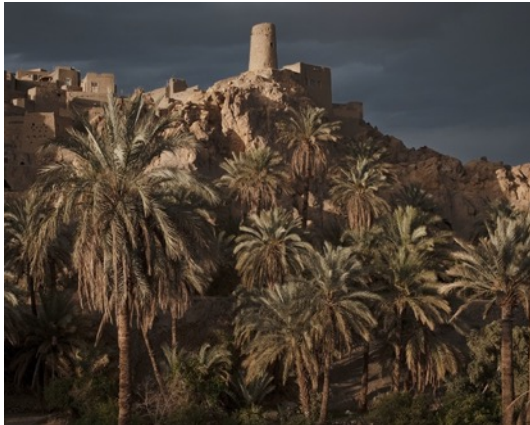
1. Alfio Tommasini, Serie Pairidaēza , 2019

Pressebilder sind in hoher Auflösung auf Anfrage oder unter www.chateau-gruyeres.ch/presse erhältlich. Die Verwendung dieser Bilder ist strikt der Werbung für die Ausstellung vorbehalten und das Copyright muss erwähnt werden.