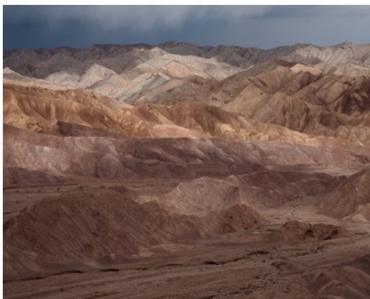
3. Alfio Tommasini, Serie Pairidaēza , 2019