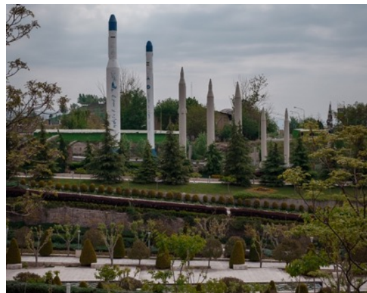
5. Alfio Tommasini, Serie Pairidaēza , 2019 © Alfio Tommasini