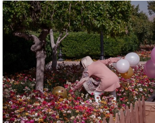
4. Alfio Tommasini, Serie Pairidaēza , 2019