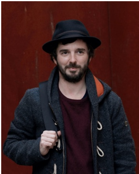
Alfio Tommasini

Alfio Tommasini, der 1979 im Tessin geboren wurde, ist ein Schweizer Fotograf, der in Madrid seine Ausbildung erhielt (Master in Dokumentarfotografie). Seine international anerkannte Arbeit wurde mehrfach ausgezeichnet: Phodar Biennial (2019); Sony Photography Awards (2018); Head On Festival Finalist (2018); Finalist des Prix PhotoForum Pasquart (2017). Zudem hat er 2013 das Verzasca Foto Festival im Tessin mitbegründet, dessen künstlerischer Leiter er ist.